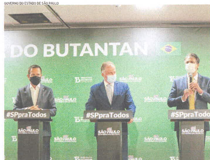
GOVERNADOR de São Paulo, João Dória; do Espírito Santo, Renato Casagrande; e do Ceará, Camilo Santana, na cerimônia em São Paulo