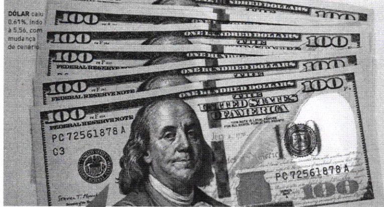
DÓLAR caiu 0,61%, indo a 5,56, com mudança de cenário