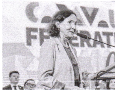
IZOLDA Cela deixou o cargo de secretária executiva do MEC

O ministro Camilo Santana (PT) se pronunciou oficialmente nesta terça-feira, 4, quanto à saída da ex-governadora do Ceará, Izolda Cela (PSB), da pasta de Educação do Governo Federal. Camilo desejou boa sorte aos próximos projetos da agora ex-secretária executiva do MEC, cujo nome agora ganha mais força como possível pré-candidata da base do prefeito Ivo Gomes (PSB) à Prefeitura de Sobral, no pleito deste ano.