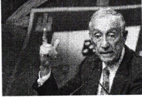
PRESIDENTE de Portugal, Marcelo Rebelo de Sousa, admitiu crimes cometidos no passado de Portugal