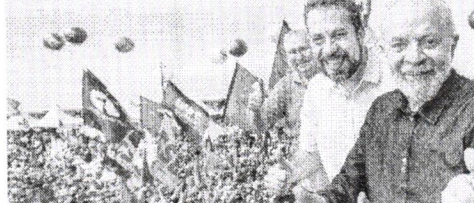
PRÉ-CANDIDATO a prefeito de São Paulo, deputado Guilherme Boulos (Psol) e o presidente Lula no ato em comemoração ao 1º de Maio

O ato de 1º de Maio, organizado pelas centrais sindicais em São Paulo, contou com um pedido explícito de votos do presidente da República, Luiz Inácio Lula da Silva, ao pré-candidato Guilherme Boulos (Psol), o que e vedado pela legislação eleitoral no período de pré-campanha. Além disso, participantes do evento receberam panfletos contrários ao prefeito Ricardo Nunes (MDB), que deve ser adversário de Boulos na campanha à Prefeitura da capital em 2024, e favoráveis ao psolista.