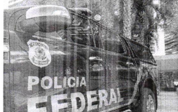
PF cumpriu 5 mandados de busca e apreensão

A ação buscou apreender mídias e documentos, além de realizar um levantamento das movimentações dos recursos que foram repassados da União para a cidade de Itaitcaba, para averiguar possíveis desvios praticados por membros da Secretaria de Educação e da comissão de licitação do município.