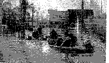
CALAMIDADE no Rio Grande do Sul