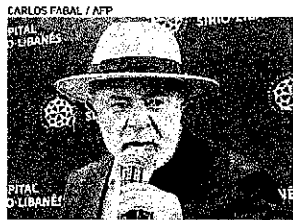
PRESIDENTE Lula: pesquisa mostra dificuldade