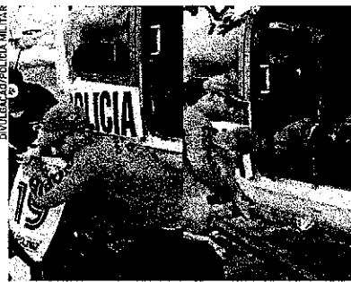
1050 foi resgatado com dois cachorros de zona rural de Independência após enchentes

| INDEPENDÊNCIA | Ninguém ficou ferido. A remoção das pessoas foi realizada com ajuda da Polícia Militar, Corpo de Bombeiros e Ciopacr