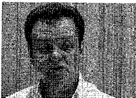
GILBERTO Kassab, presidente nacional do PSD