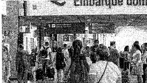
FRAPORT aponta Espanha e Holanda como destinos que precisam ser retomados

De acordo com a secretária, apesar da busca constante por novos destinos com rotas no Ceará, o setor aéreo está muito disputado tanto nacional quanto internacionalmente por causa da falta de aeronaves suficientes no mercado.