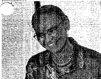
MARINA Silva é ministra do Meio Ambiente e Mudança do Clima