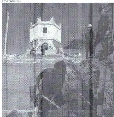
A EMPREGABILIDADE na região também corre risco

A Setur explica que pagamentos ocorrem por medições e parcelas deviam ser pagas nos períodos: (21/10/2024 a 20/10/2024), (21/10/2024 a 20/11/2024) e (21/11/2024 a 31/12/2024). Ainda conforme pasta, sem