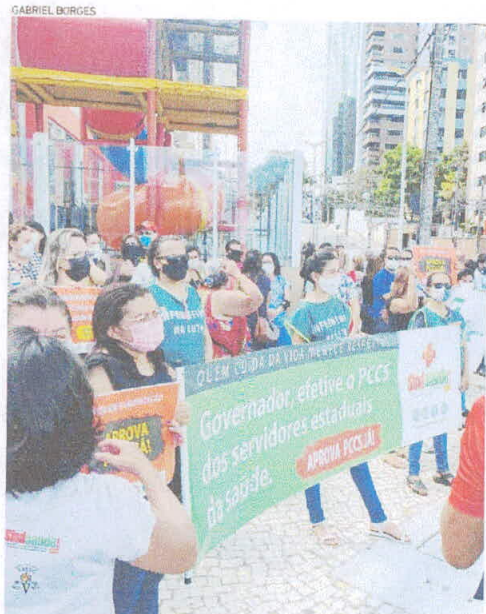
MANIFESTANTES estiveram reunidos a cerca de 400 metros do Palácio da Abolição

I | ESTADO | Em ato realizado ontem, 21, manifestantes chegaram a convocar colegas para uma paralisação amanhã